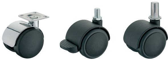
verchromt harte Lauffläche